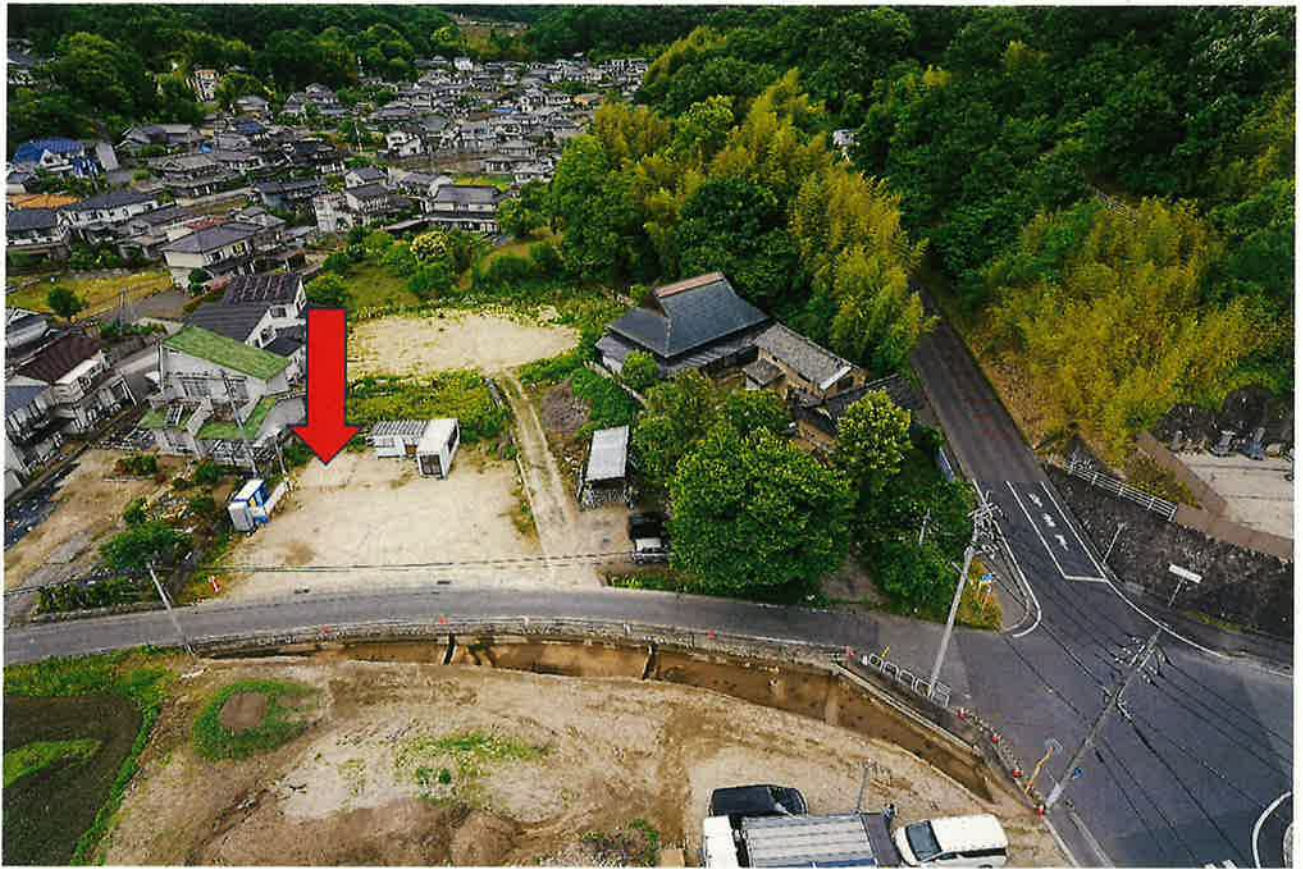
プレハブ予定地（ニ才原遺跡）