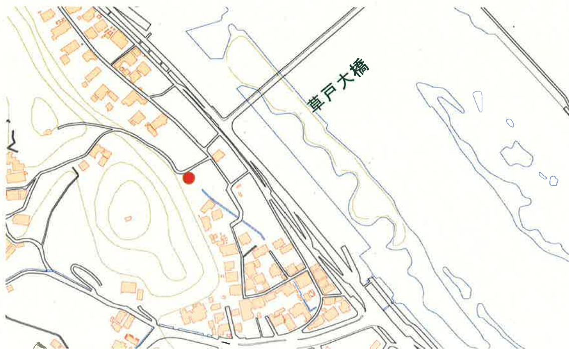
(地理院地図 電子国土 Web に加筆)