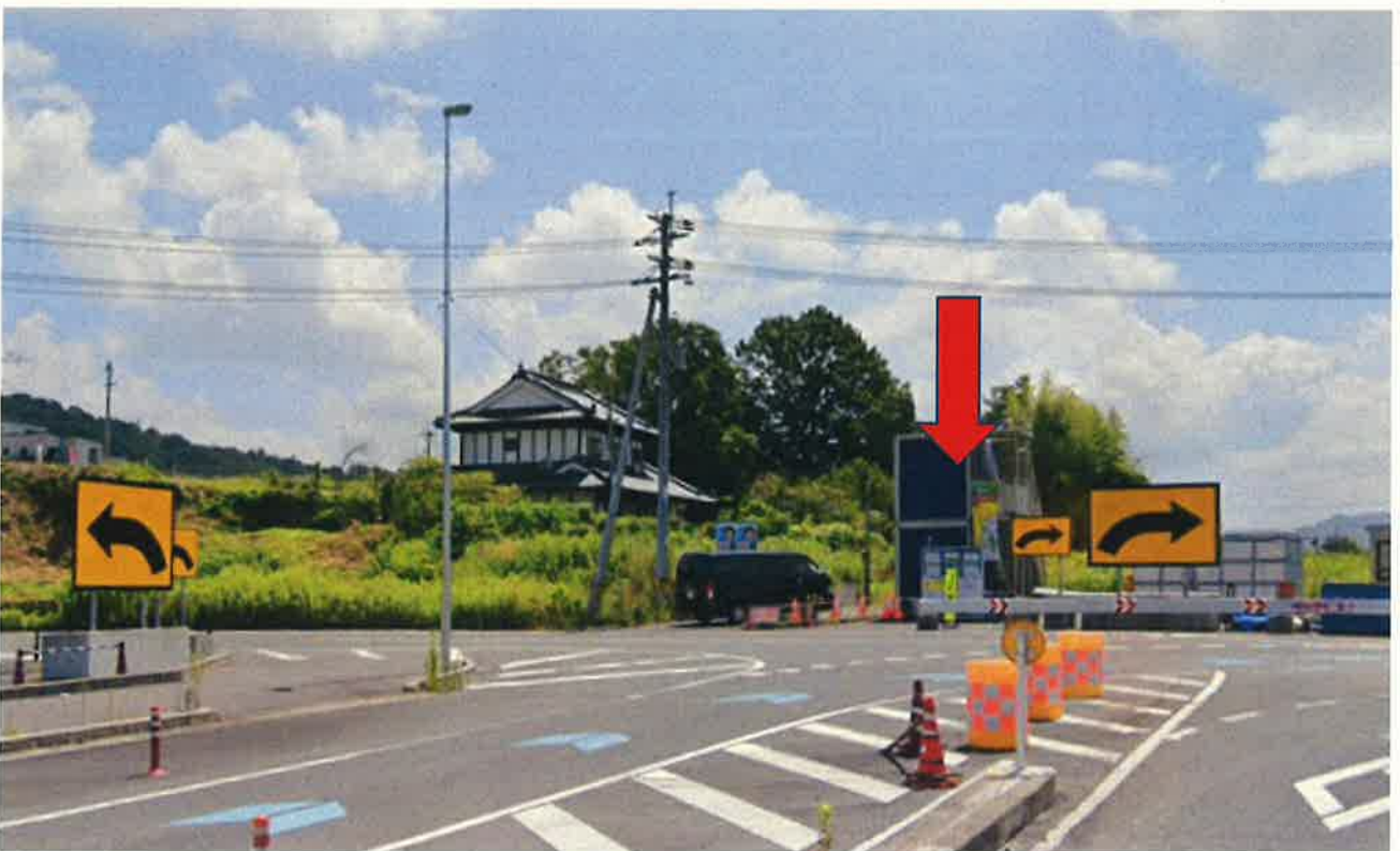
※青色のプレハブは撤去済