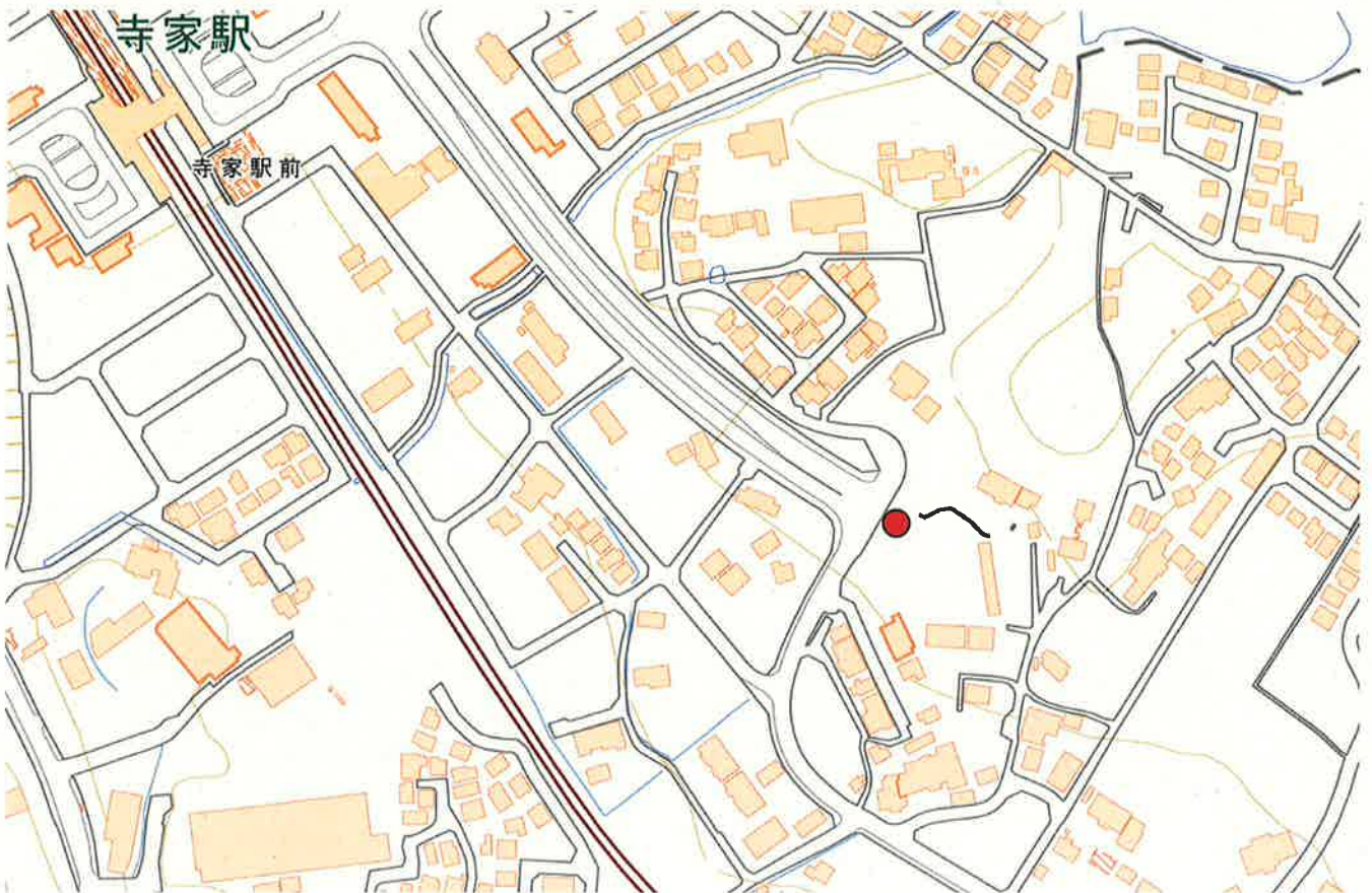
(国土地理院地図 電子国土 Web に加筆)