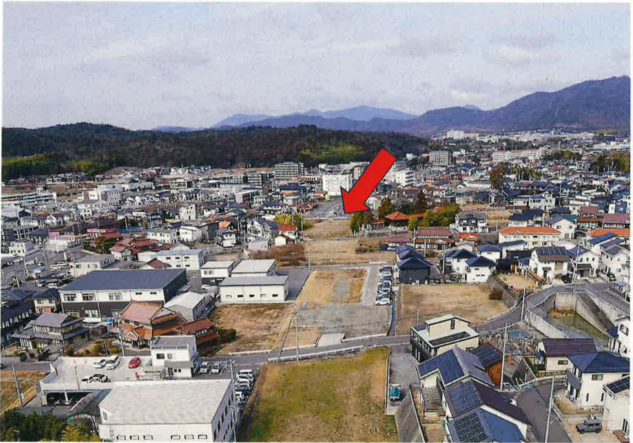
プレハブ予定地（福原2号遺跡）