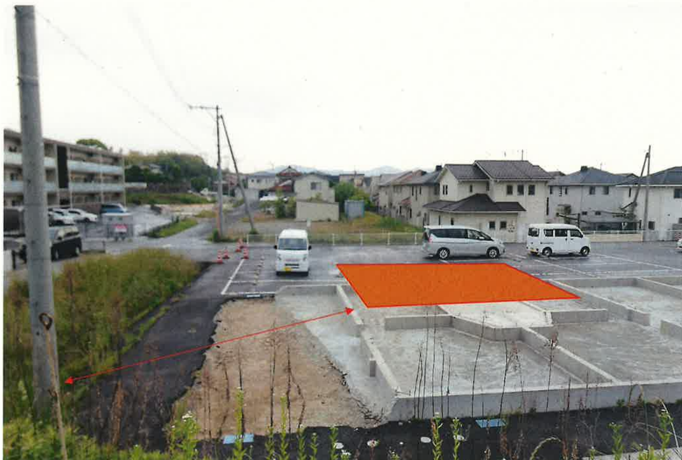
※電柱からプレハブ予定地まで約 15 メートル