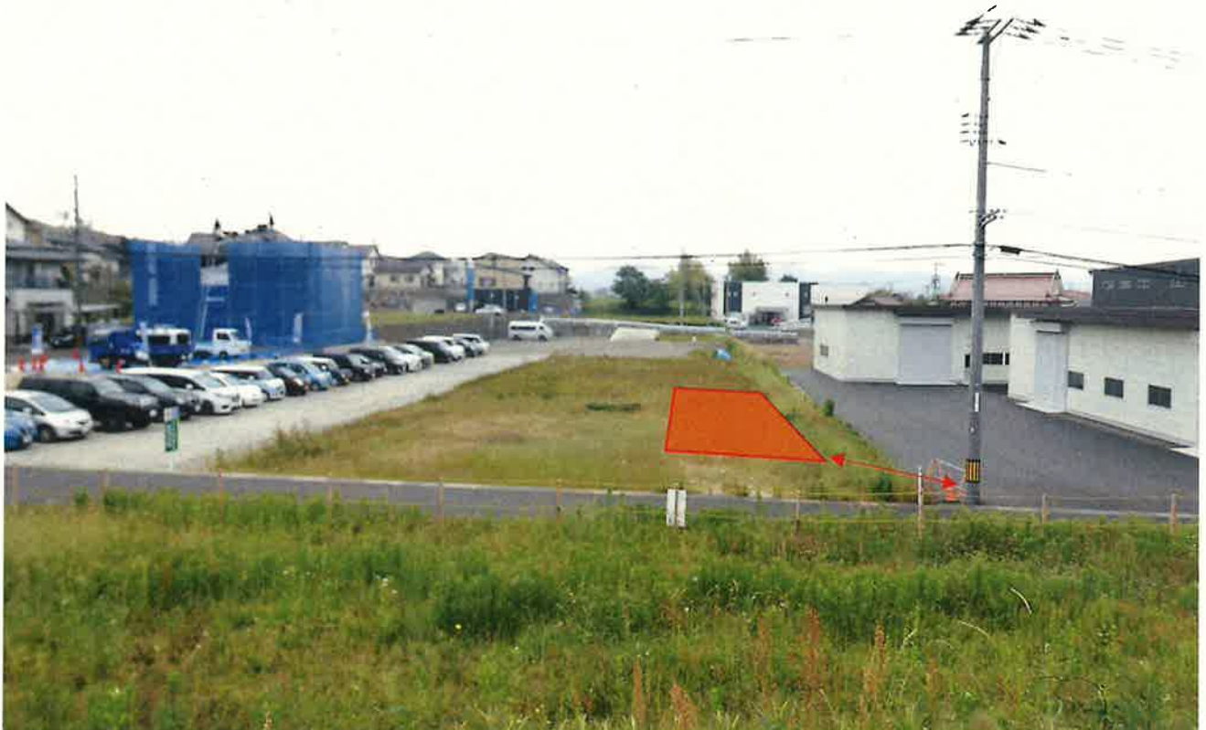
※電柱からプレハブ予定地まで約 15 メートル