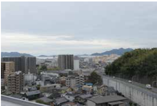
草津城跡からの景色