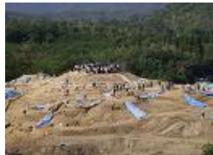
宮ノ本古墳群 (三次市) 現地説明会 (2007)

なお、感染症拡大防止の観点から、講師及び参加者相互の距離を確保するため、事前申込制としておりますので、ご協力をお願いします。