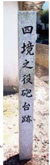
和木町・さくら遊園地