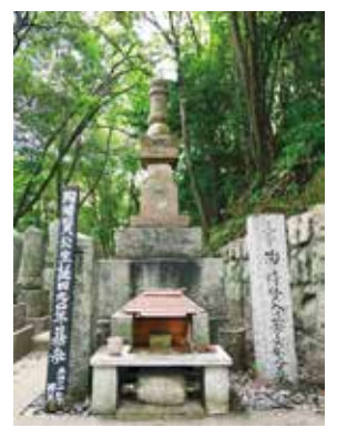
陶晴賢の首塚(洞雲寺)