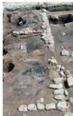
発掘調査でみつかった慶応2(1886)年の火災跡