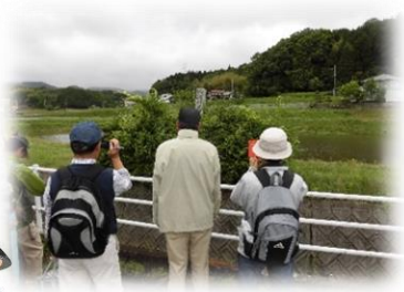
「武田元繁戦死の地」碑