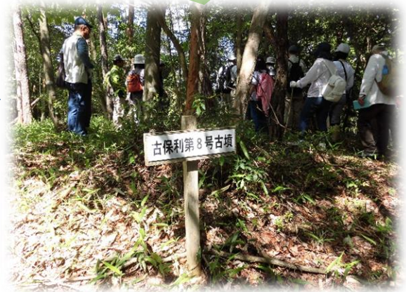
「古保利第8号古墳」(前方後円墳)