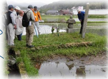
「己斐宗瑞戦死の地」碑